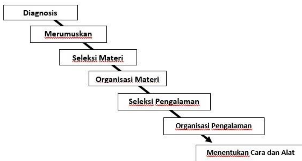
Gambar 1. Model Kurikulum Hilda Taba

Jika tujuan sudah ditentukan maka berlanjut kepada penentuan materi yang akan diberikan beserta pengalaman belajarnya, dan untuk mengetahui keberhasilan dari kurikulum maka perlu adanya evaluasi. Proses kurikulum dalam model kurikulum Taba tergambarakan seperti gambar dibawah ini :